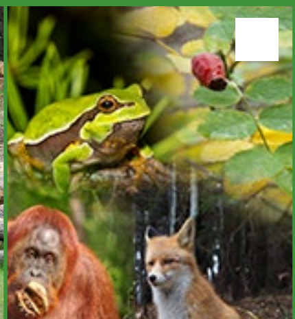
Extinción de especies