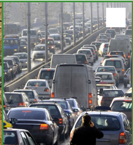
El tráfico de coches